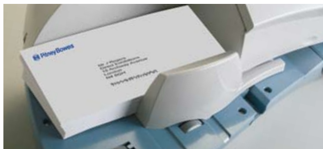
Automatische toevoer voor een snelle verwerking van uw post