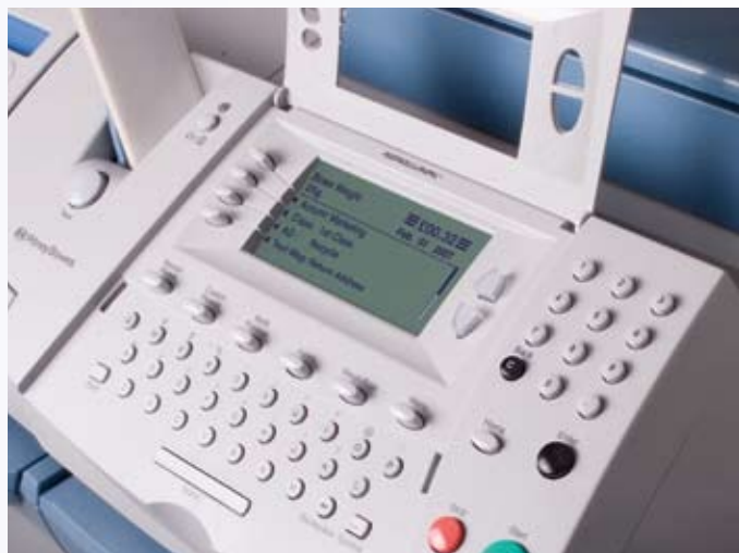
Voeg gemakkelijk een standaardtekst toe dankzij het qwerty-toetsenbord

Maak van uw poststuk een drager die de aandacht trekt. Maak reclame voor uw bedrijf met een inkjetopdruk op elk poststuk om uw professionele imago op te bouwen. De DM400c™ & DM425c™ laat u toe een retouradres of een boodschap te printen naast uw slogan, zodat niet afgeleverde post naar u teruggestuurd wordt. Zo kunt u uw mailingdatabase corrigeren en de kosten voor latere mailings drukken. De tekst kan gemakkelijk ingevoerd worden via een ingebouwd qwerty-toetsenbord.